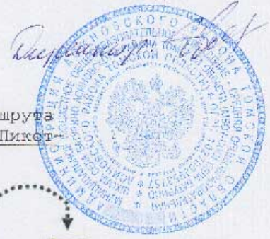
Схема маршрута школьного автобусного маршрута Батурино (МБОУ-СОШ) - Лермонтова - Ноль-Пикет - Первопашенск - Батурино (МБОУ-СОШ)